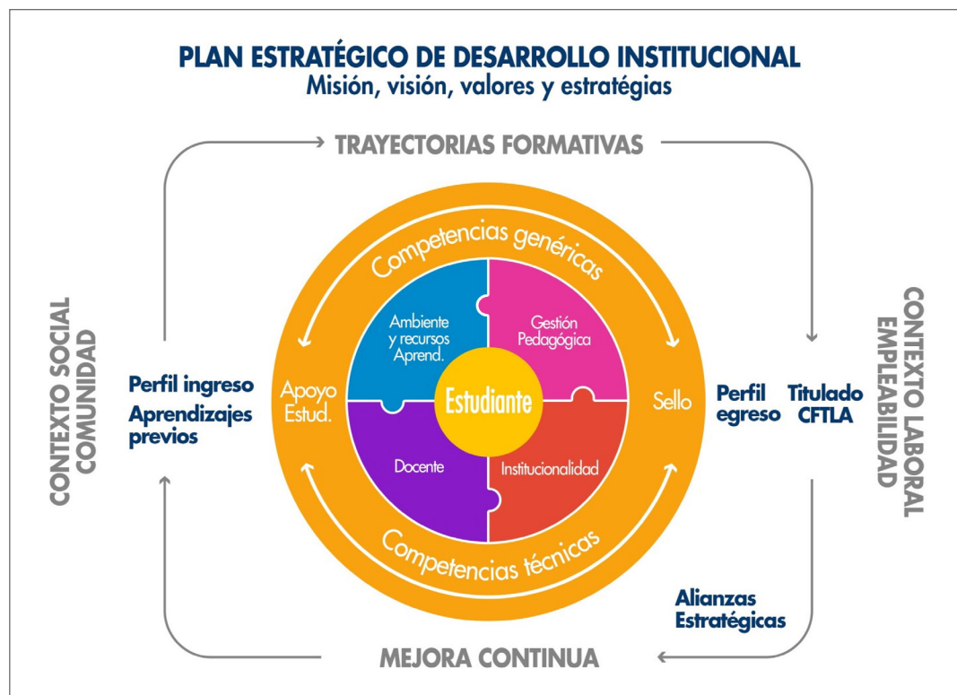
ESQUEMA 1: Modelo Educativo CFT Lota Arauco.

A continuación, se representa la articulación de los actores y elementos que componen el Modelo Educativo del CFT Lota Arauco.